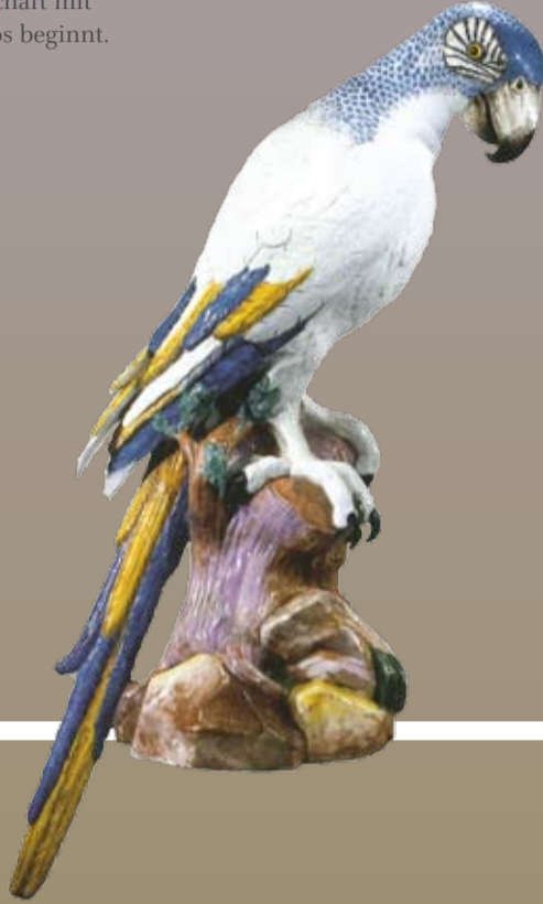
BLAUER ARA Meissen Johann Gottlob Kirchner 1731

»Triumph der blauen Schwerter« gibt einen groß angelegten Überblick über die künstlerische wie technische Entwicklung des Meissner Porzellans und öffnet gleichzeitig durch sozial- und wirtschaftshistorische Fragestellungen einen neuen Blick auf das »Weiße Gold« aus Sachsen.