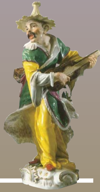
MALABARE Meissen Elias Meyer 1748 bis 1749

Schau zu einem Ereignis: Nach fast 300 Jahren wird 2010 erstmals wieder Meissner Porzellan in dem Schloss zu sehen sein, das August der Starke einst ausschließlich der Präsentation der königlichen Porzellanschatze aus China, Japan und Meissen gewidmet hatte, im Japanischen Palais. Ganz im Sinne seines Schöpfers wird sich das Palais einen Sommer lang wieder in ein Porzellan Schloss zurückverwandeln.