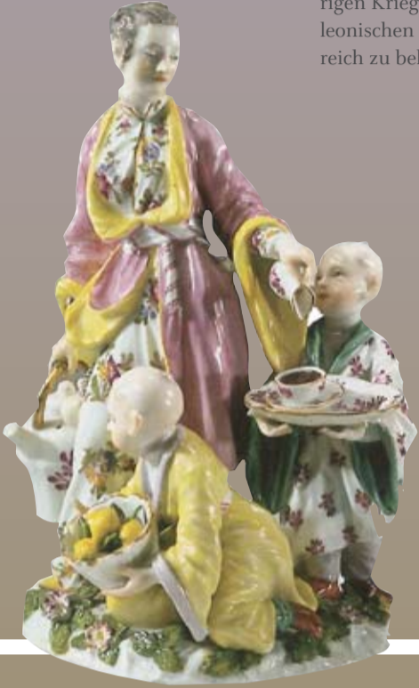
JAPANERIN MIT IHREN KINDERN BEIM SERVIEREN VON TEE Meissen Johann Joachim Kaendler um 1750

Hälfte des 18. Jahrhunderts seine größten Triumphe. Das Meissner Porzellan verkörperte die europäische Porzellankunst schlechthin, trotzte lange dem Konkurrenzkampf zwischen den neu entstandenen Manufakturen, um sich schließlich nach den Krisen des Siebenjährigen Krieges und der Napoleonischen Kriege erneut erfolgreich zu behaupten.